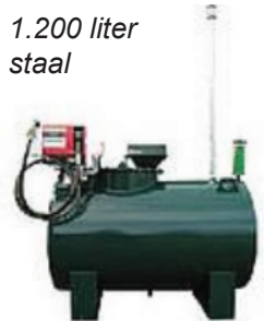
1.200 liter staal