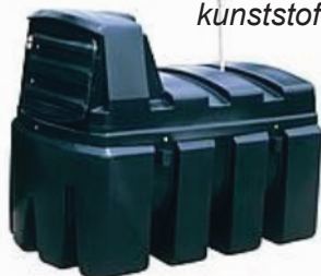
2.500 liter kunststof