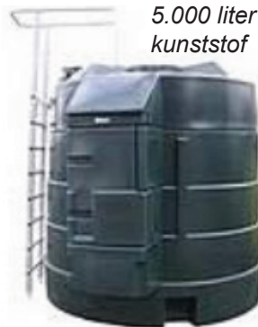
5.000 liter kunststof