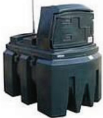
1.300 liter kunststof