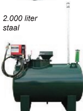
2.000 liter staal